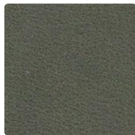
7875 dark olive