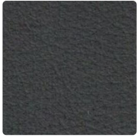
0523 black off

Die am Bildschirm dargestellten Farbmuster dienen als Anhaltspunkte. The colour samples presented are indicative only